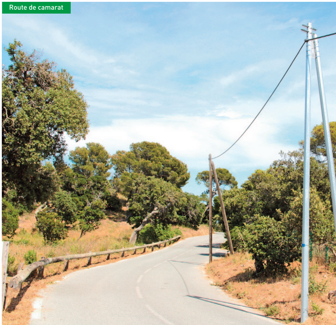
Route de camarat