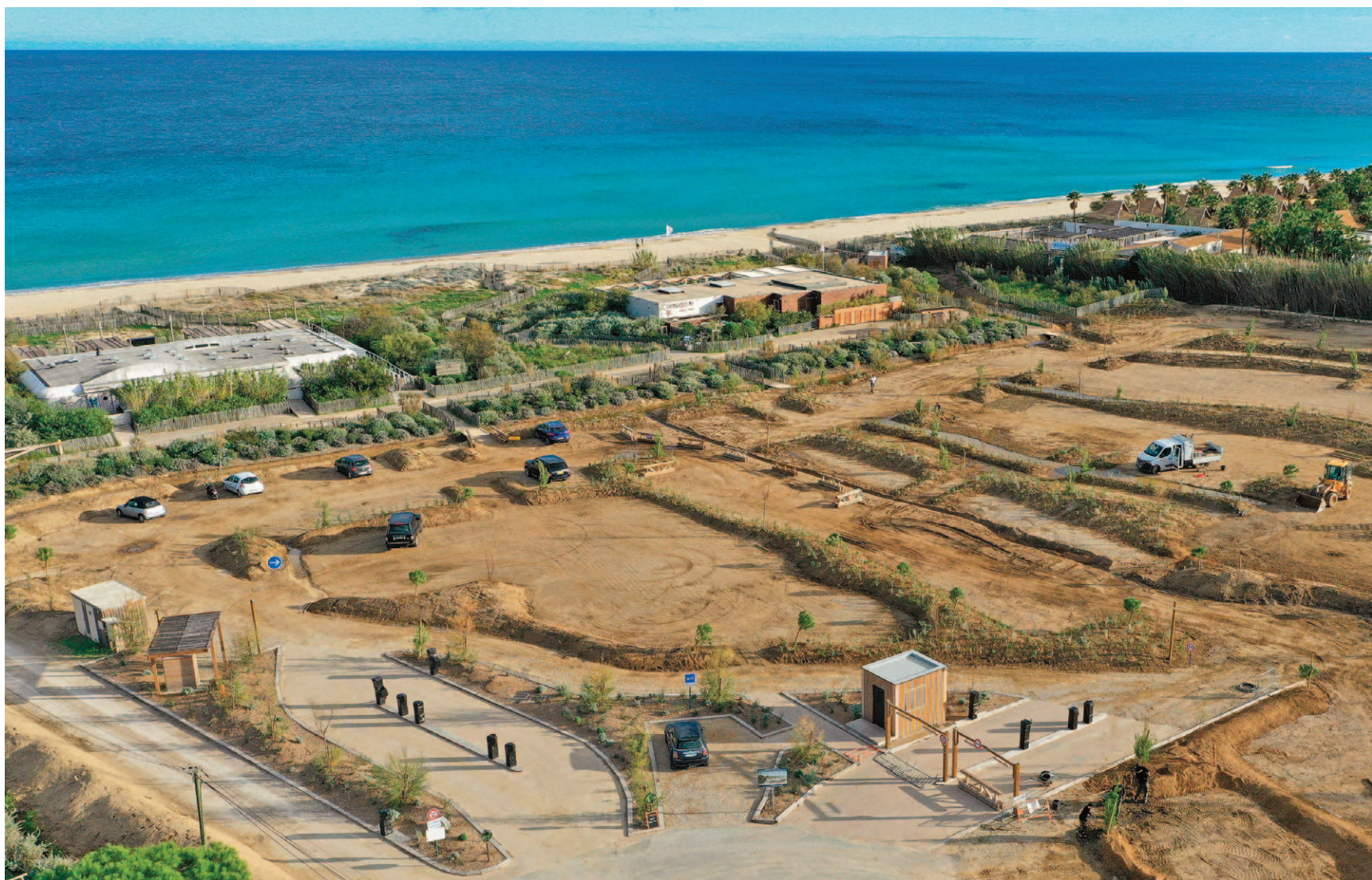
SCHÉMA D'AMÉNAGEMENT DE LA PLAGE

Poursuivre l'intégration paysagère et l'amélioration des conditions d'accès sur le domaine public maritime, gérer le développement environnemental des espaces protégés, organiser le mouillage pour protéger l'herbier de Posidonie.